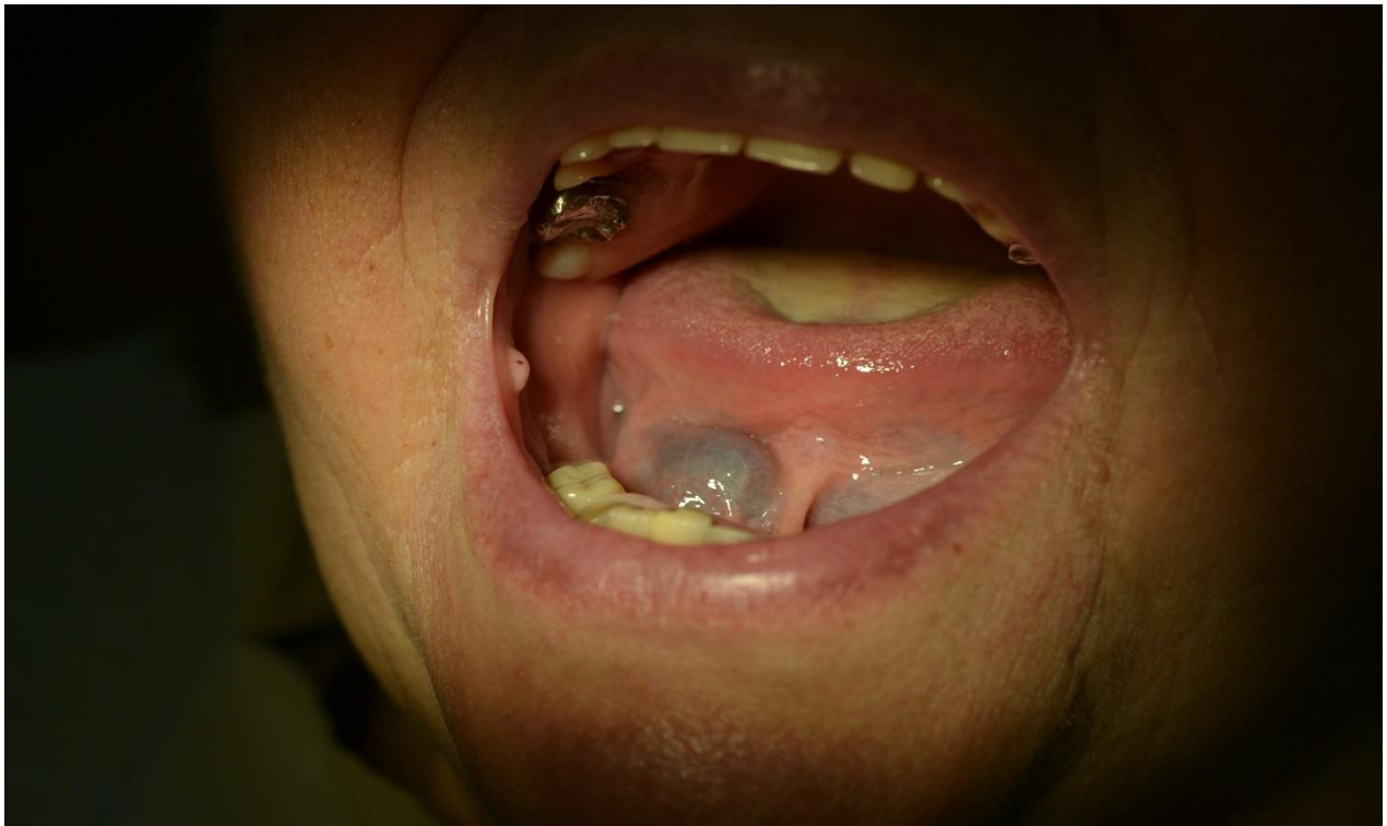
Ryc. 1. Obraz kliniczny torbieli ślinianki podjęzykowej.