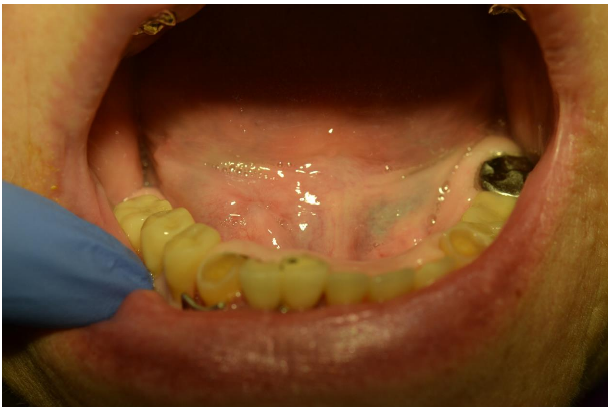
Ryc. 4. Wizyta kontrolna po 10 dniach.