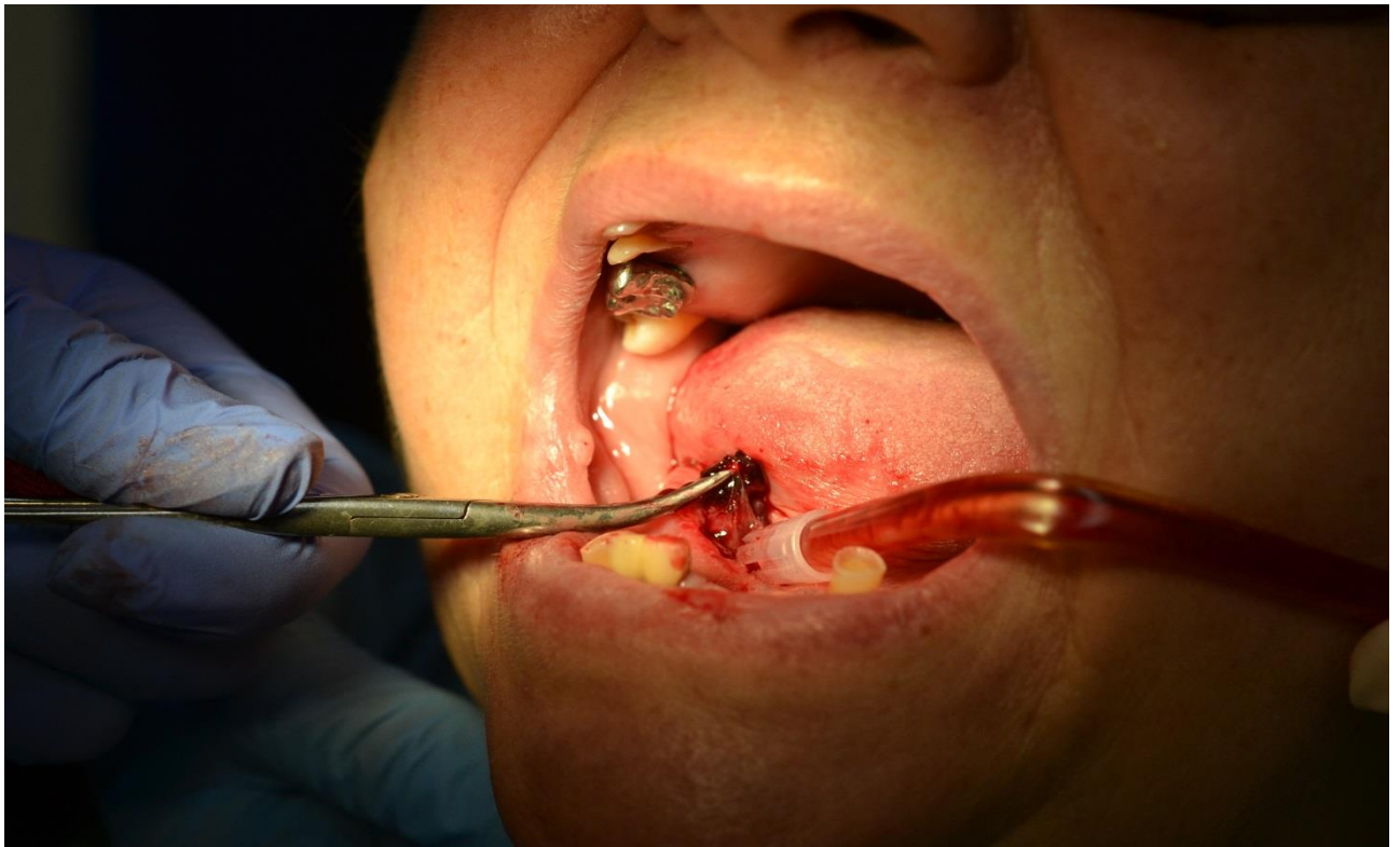
Ryc. 3. Wyluszczenie torbieli.